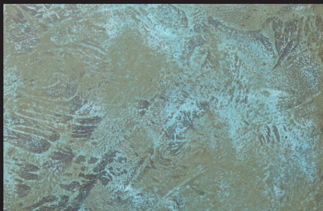
Oxide Latón + Agente oxidante