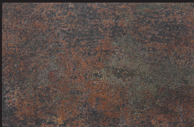
Oxide Hierro + Agente oxidante