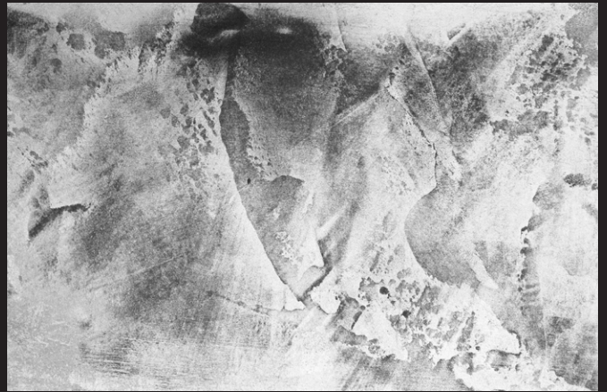
Blanco Plata 500