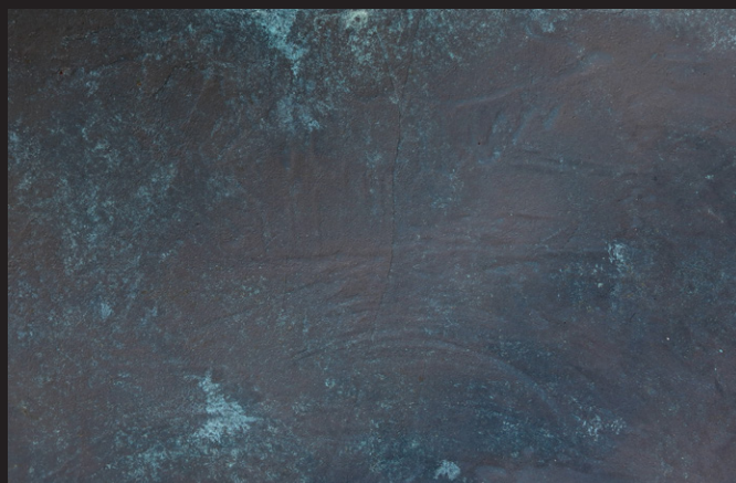
Oxide Bronce + Agente oxidante