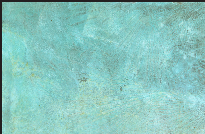
Oxide Cobre + Agente oxidante